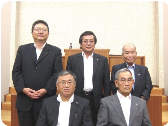
総務産業経済常任委員会