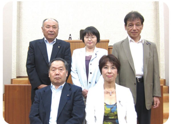
教育厚生常任委員会