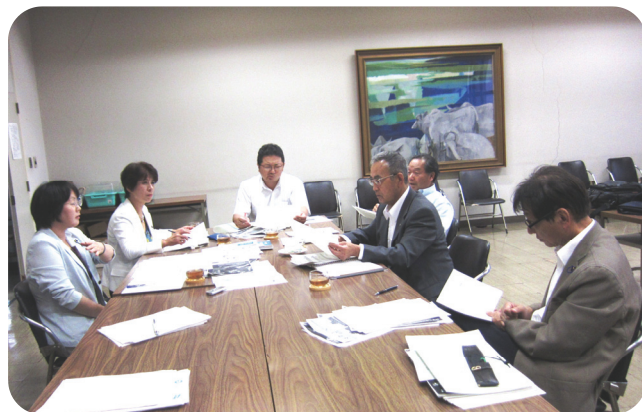
【議会だより編集会議 H23年9月16日】