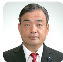
豊嶋 浩三 議員

豊嶋 29年度個人の月間最高残業時間が102時間45分であることは、早急に改善策を講ずるべきであり、タイムカード等により労務管理の最適化をすべきでは。