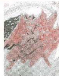
金時人参と おかか和え