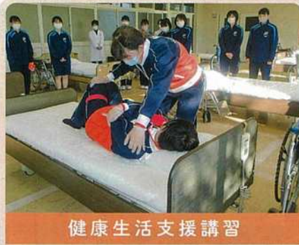
健康生活支援講習

家族や地域の高齢者との接しかたと介護のしかた、自分が高齢期をすこやかに迎えるための知識や技術について学べます。