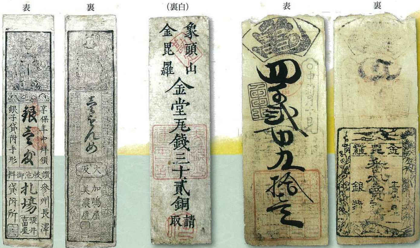
榎井 吉田屋 (享保年中 銀一匁)

現代では日本銀行が発行する紙幣が全国共通で流通していますが、江戸時代には藩が幕府の許可を得て各藩独自で「藩札」と呼ばれる紙幣を発行し、藩の財政を支え、江戸時代中頃から明治初めの流通停止までにさまざまな藩札が流通しました。県内屈指の藩札収集家が収集、発掘した今では入手困難な高松藩、丸亀藩、多度津藩の発行した藩札を一堂に見ることができる貴重な機会をお楽しみください。また琴平町で流行った富くじも展示します。