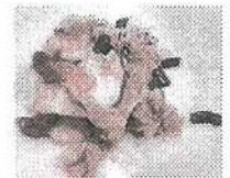
豚肉と山芋の梅生姜焼き

主な料理例：みそ炒め ・味噌煮 ・豚キムチ ・納豆炒め ・ビール煮 ・酢豚 ・生姜焼き 等