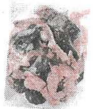
茄子の豚キムチ炒め

どこのお家にも今の時期たくさんあると思います。冷房で冷えた内臓を温めるという意味で、ぜひお味噌汁で食べてもらいたいです。熱中症予防で、冷房は必須ですが、冷房病にも気をつけなければいけません。発酵食品であるお味噌に、茄子の栄養素をプラスして腸内環境を良くして元気に過ごしましょう。