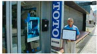
優良事業所表彰 株式会社村井住宅設備