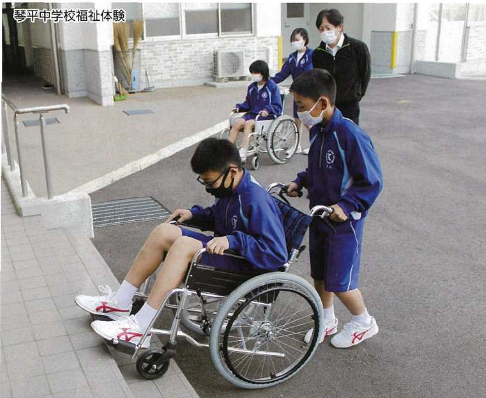
赤い羽根共同募金学校募金協力