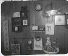
味わいのある道具たち

道具を買ってくれた人が自分が思いつかなかったアイディアで古道具を楽しんでくれているのをSNSで見ると嬉しいです。