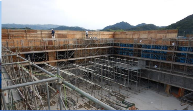
体育館棟アリーナ足場建設の様子

体育館棟の屋上及び屋上からの立ち上がりのコンクリート打設が完了しました。 続いて、屋根工事を行う為の足場をアリーナ内部に組立て中です。