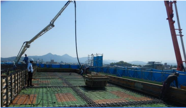
体育館棟屋上コンクリート打設前