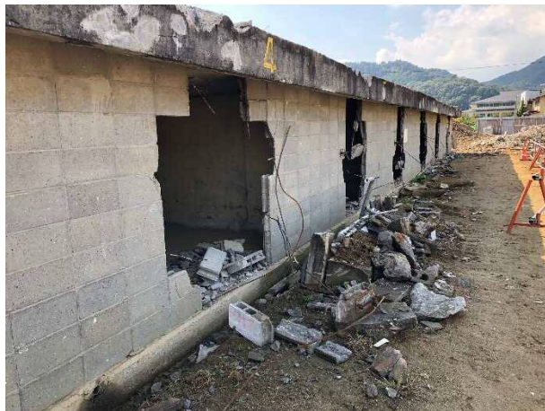
① プール棟を解体しています