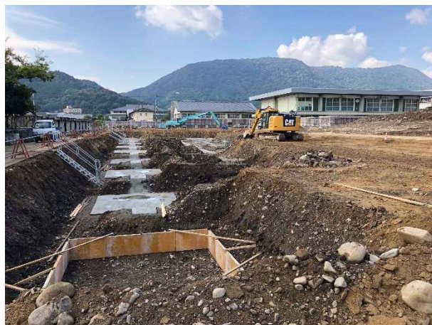
④ 基礎の底面を平らにして作業をしやすくするための捨てコンクリート作業です