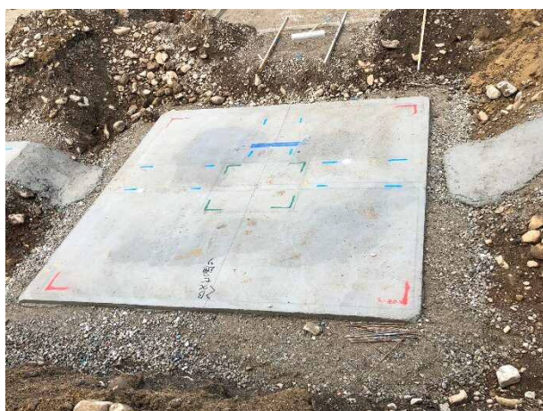
⑤ 捨てコンクリートに柱や壁の位置を示しています（墨出し）