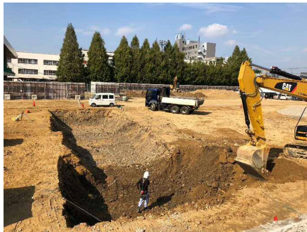
② 基礎や地下構造物を埋設するために掘削を行っています