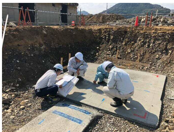
⑥ 工事監理者等による墨出し確認を行っています