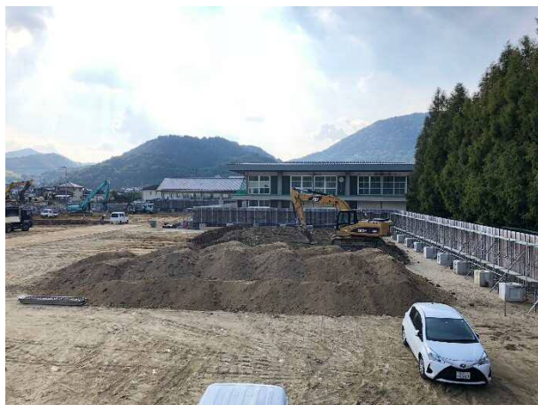
③ 掘削された土が積み上がっています