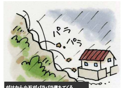
がけから小石がバラバラ落ちてくる