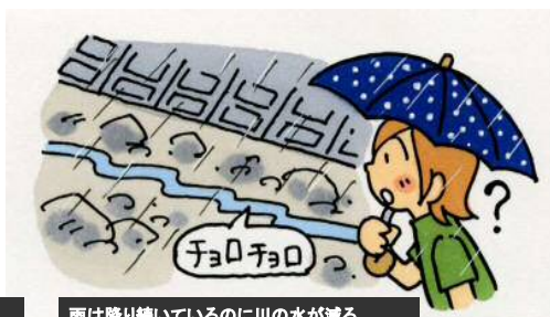
雨は降り続けているのに川の水が減る