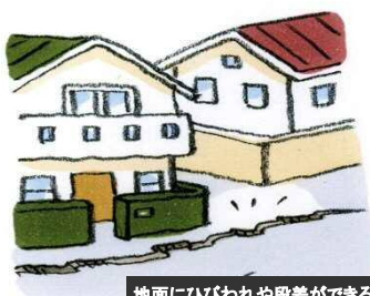
地面にひびわれや段差ができる