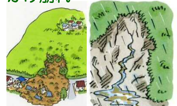
がけから急に水が湧き出る