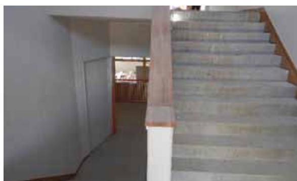
階段内壁塗装後【校舎棟】