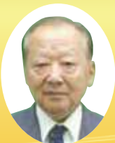
香川県社会福祉協議会会長表彰 民生委員・児童委員功労