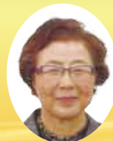
香川県社会福祉協議会会長表彰 民生委員・児童委員功労