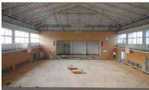
アリーナのフローリング施工の様子【体育館棟】