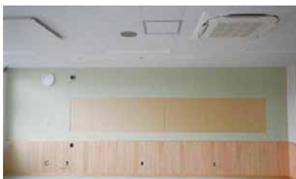
教室の様子 掲示クロス施工後【校舎棟】

【外 構】 キュービクル(変圧器)やゴミ庫、受水槽の基礎を打設し、キュービクルにおいては据付けが完了しました。今後は自転車置き場や昇降口玄関の庇などを施工していきます。