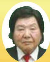
香川県知事表彰 社会福祉功労