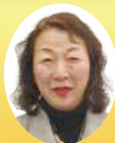
香川県知事表彰 社会福祉功労