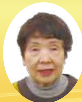
香川県社会福祉協議会会長表彰 民生委員・児童委員功労