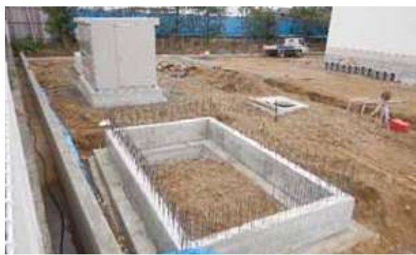
外構設備(キュービクル、ゴミ庫等)施工の様子【外構】