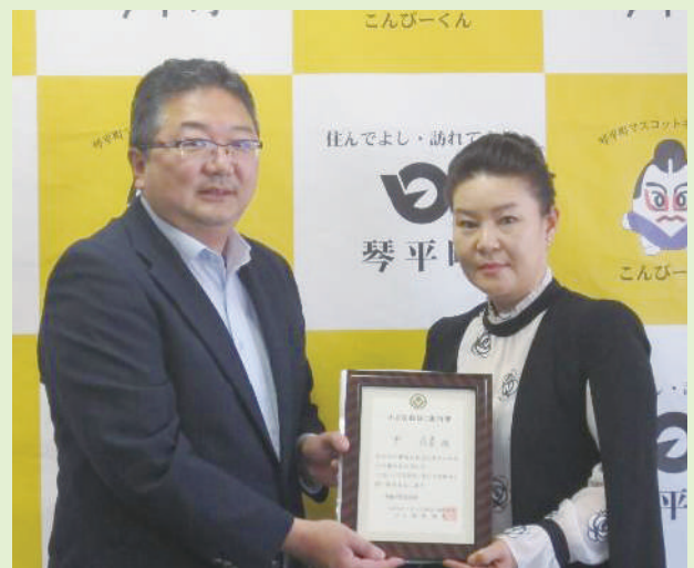
問 少年育成センター ☎75-0919