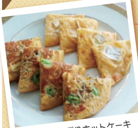
夏野菜たっぷりホットケーキ

<栄養価> (1人当たり) エネルギー 407kcal たんぱく質 16.1g 脂質 9.8g