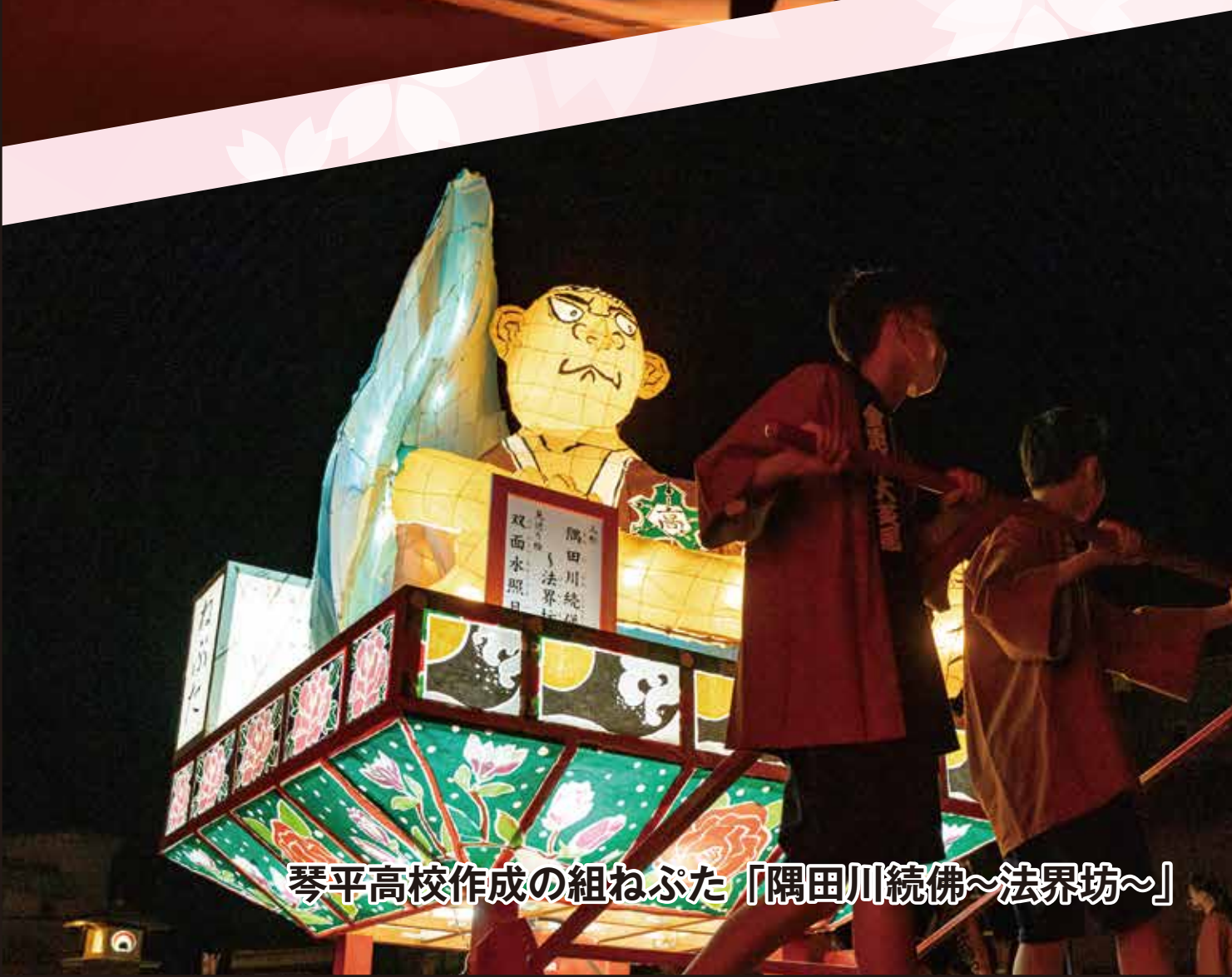
琴平高校作成の組ねぶた「隅田川続佛〜法界坊〜」