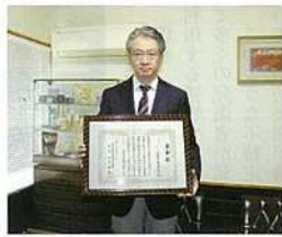
優良事業所表彰 三馬食品株式会社