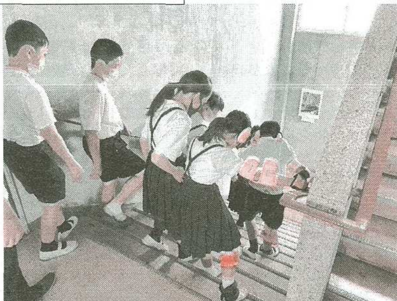
榎井小学校6年生が1学期に引き続き、まちづくり科の授業で、「人にやさしいまちづくり」をテーマに福祉について学びました。(詳細はP3)