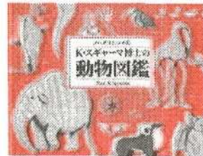
「K・スギヤマ博士の動物図鑑」

資料 当日使用する資料は、事前にお渡しします。(郵送も可) えんぴつ、色えんぴつ、クレヨン、マジックなどを準備してください。