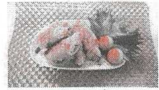
にんにく香る肉ロール