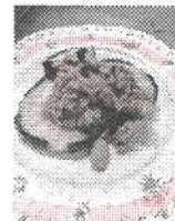
茄子の肉味噌のせ

他の野菜と比べて、ずば抜けて栄養素が豊富とは言えませんが、旬のこの時期は安値で購入することができるので、野菜不足解消に役立ててはいかがでしょうか。