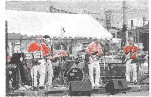
(芦原すなおとロックンギョースメン)