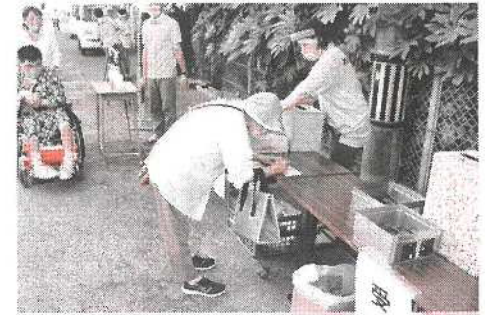
(感染対策のための受付)