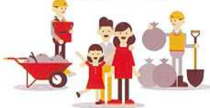
災害ボランティア支援

災害時に支援・救護を行うボランティア団体・グループに対し、活動経費の一部を適時に援助するため、準備金として積立てます。また、火災や風水害等による被災世帯に見舞金を贈ります。