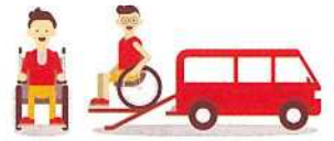
車椅子の移動車両

県内の社会福祉施設の設備や授産機器、送迎用車両の整備、福祉団体の活動等に助成します。