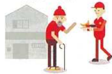
高齢者への配食サービス

社会福祉活動や在宅福祉サービス事業等、地域福祉の推進を図る市町の社会福祉協議会の活動等に助成します。