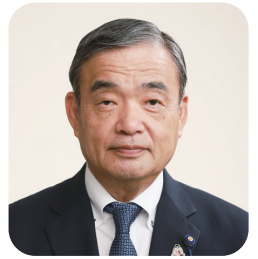
豊嶋 浩三 議員

町長 国の財政的な支援の状況や財源の確保が確定していないこと、また、こども園や小学校の統合等に多大な費用が見込まれることなどから、現時点では2歳未満児の保育料無料化についてはなかなか難しい。