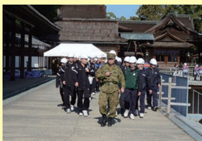
自衛隊員先導による下山訓練