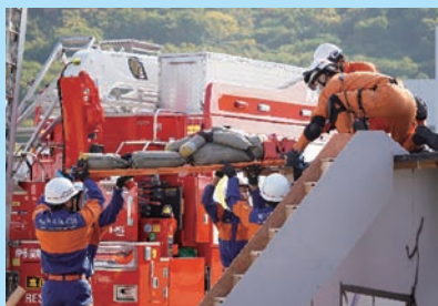
琴平町消防団 要救助者の担架搬送