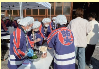
婦人防火クラブ炊き出し訓練