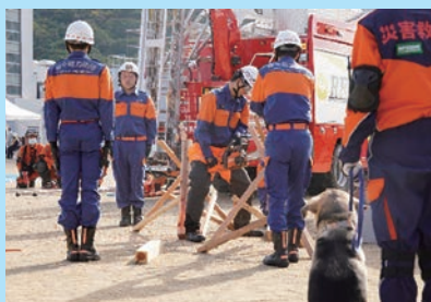
琴平町消防団 進入路確保のための資機材訓練