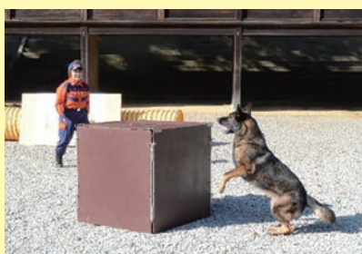
災害救助犬デモンストレーション