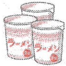
インスタント食品