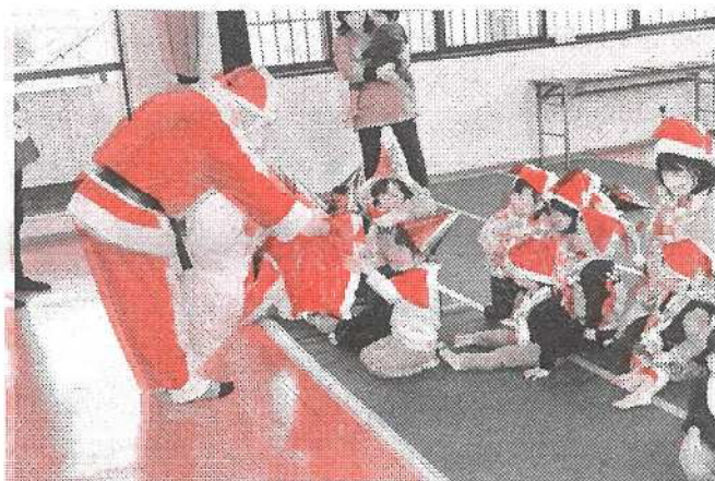
(サンタさん登場で大興奮!)