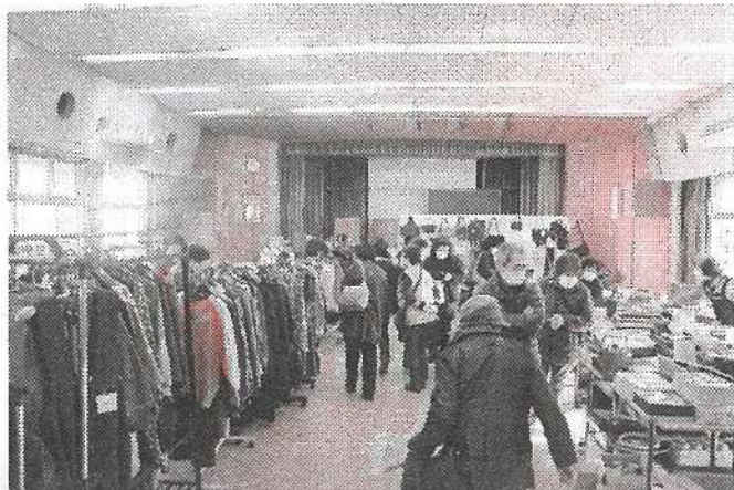
(多くの方にお越しくださいました)

少しだけ例年と違ったチャリティー作品即売展でしたが、大勢の方の来場がありました。このチャリティーで得た収益は、右の写真の活動(一部)に繋がっています。