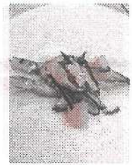
(ししゃものマリネ)

丸ごと食べられるので、豊富な栄養を無駄なくとれるのが魅力です。切り身で食べる魚に比べてカルシウムを多く摂取できます。しかし、残念ながら塩分が少し多いので一緒に食べるもので調整する必要があります。赤ちゃんの離乳食には不向きです。南蛮漬けやマリネにすると野菜も一緒にとれるし、お酢も使うので最高に栄養満点の食べ方だと思います。