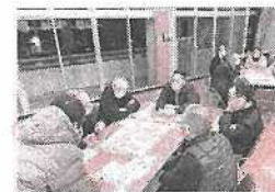
サンタクロース訪問

12月20日(火)に榎井地区の自治会長、福祉委員、民生委員の皆さんに集まっていたいただき、これまでの榎井ハッピーネットの取り組みと、榎井地区の課題とこれからのようなことをしていくのかをカードワークをしながら話し合いをしました。とても盛り上がり、時間が来ても話している姿を見て、こういう場はとても大事なんだと改めて思うことができました。