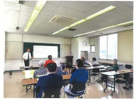
4月の地域向け説明会の様子

琴平mobiは、定額で琴平町内乗り放題の新しい移動サービスです。単なる便利な乗り物ではなく、いつでもだれでも自由に移動できるようになる事で、会員の皆様には、健やかで豊かな人生をお送りいただくお手伝いがしたいと考えています。説明会、イベント出店ともに、事業内容の説明や登録方法、操作方法など、なんでも受け付けております。ぜひ、気軽にお越しください！