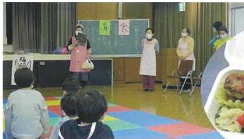
R5.1月 おやこの食育教室