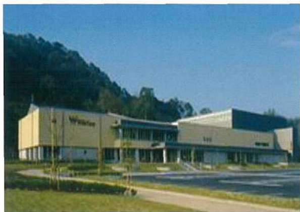
ヴィスポことひら TEL 75-0010